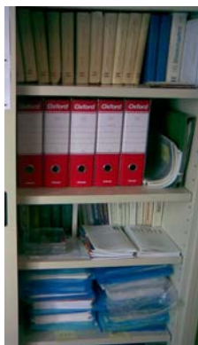
Opera in Tedesco antico e moderno Fatture e Contabilità