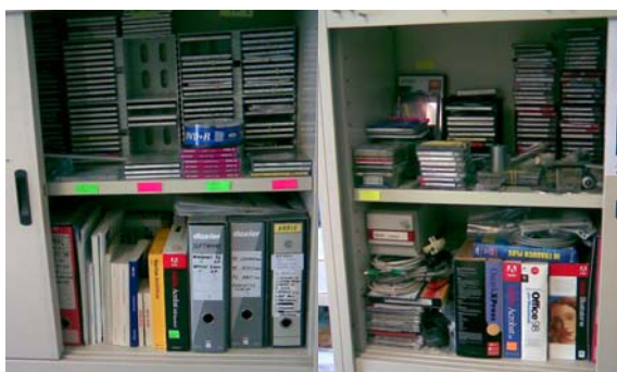
Archivio DATI e PROGRAMMI

Ecco le foto che mostrano i computer, le attrezzature e il magazzino dei libri della Casa editrice.