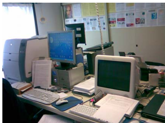
Computer e stampanti laser